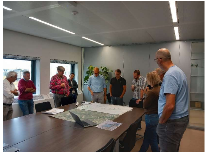
Figuur 3 sfeerbeeld werksessie Ruimtelijke kwaliteit