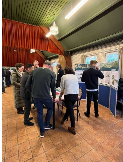
Figuur 4 sfeerbeeld inloopavond

Er zijn geen knelpunten of problemen naar voren gekomen die vaststelling van het VKA in de weg zouden kunnen staan. Omwonenden en belanghebbenden kunnen naar aanleiding van het concept voorkeursalternatief hun ideeën en aandachtspunten voor de verdere uitwerking van het ontwerp bespreken met het waterschap.