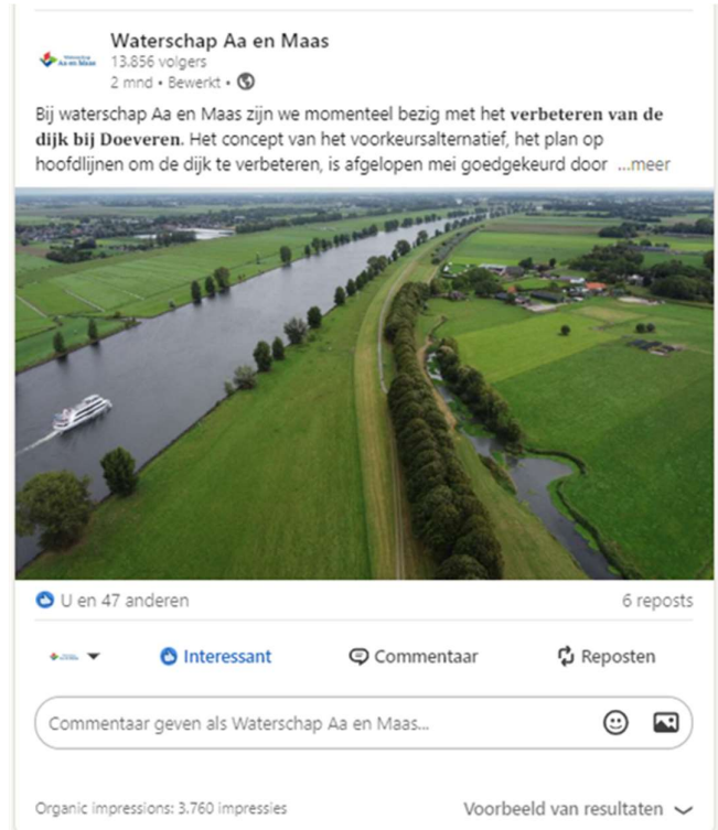
Figuur 2 Voorbeeld LinkedIn/Facebook-bericht