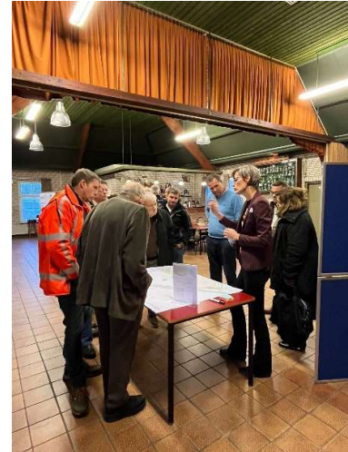
Figuur 3 sfeerbeeld inloopavond

Er zijn geen knelpunten of problemen naar voren gekomen die vaststelling, publicatie en terinzagelegging van het vergunbaar ontwerp in de weg zouden kunnen staan. Omwonenden en belanghebbenden kunnen tijdens de terinzagelegging indien gewenst een zienswijze indienen.